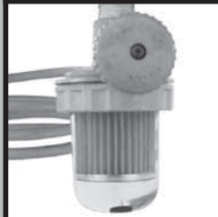
汚れたフィルター